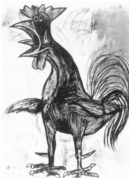
Εικόνα 12. Πικάσο, Κοκοράκι , 1938